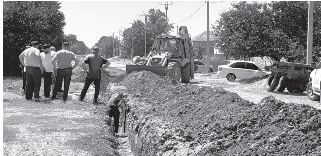
Ведется работа по замене старых водопроводных сетей