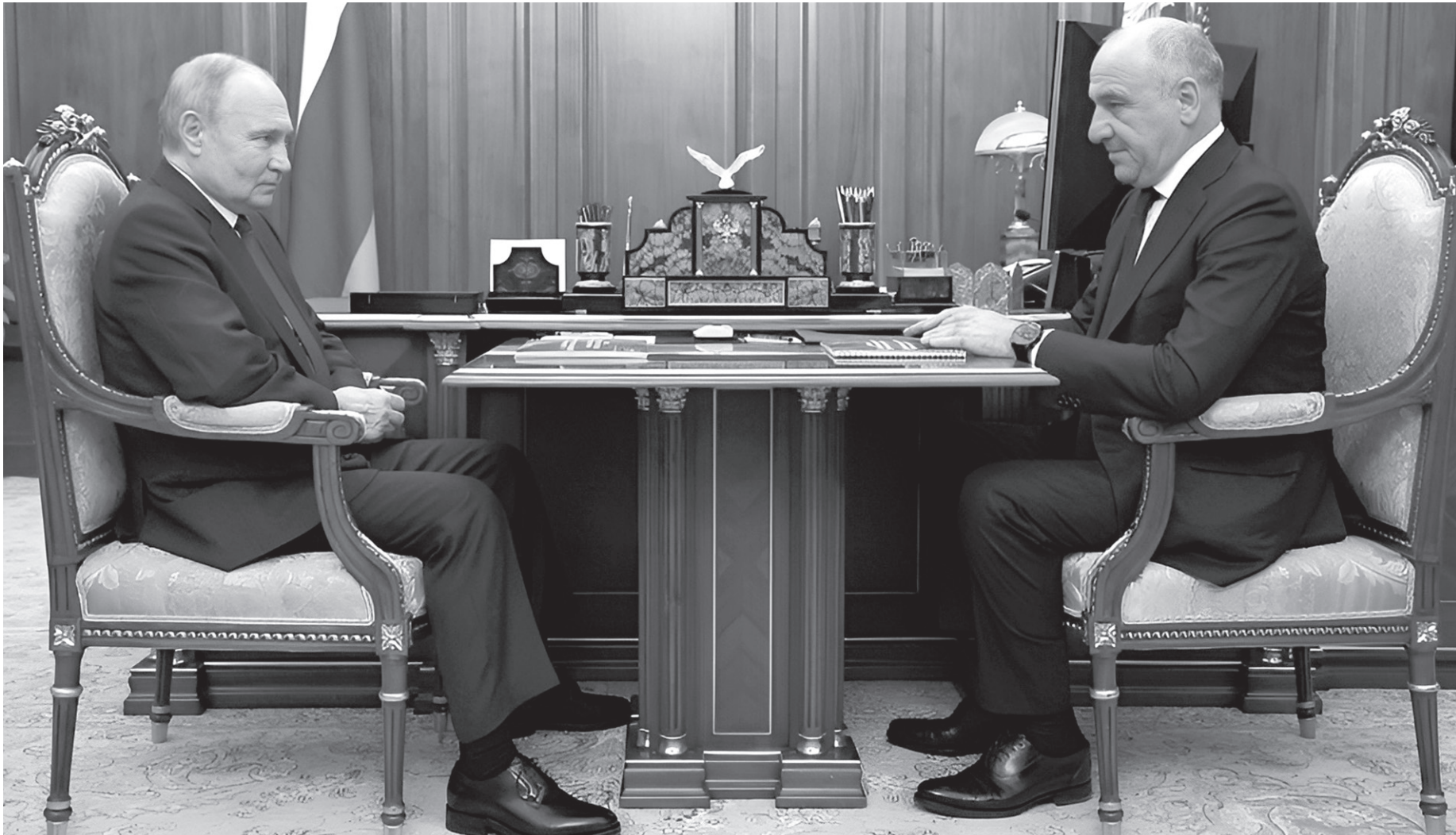
Рабочая встреча Владимира Владимировича Путина и Рашида Борисовича Темрезова

Кстати, когда разговор коснулся образовательных организаций, особый акцент был сделан на необходимости увеличения мест в детских садах, а также решении вопроса со второй сменой в школах. Рашид Темрезов заверил, что до 2030 года респу-