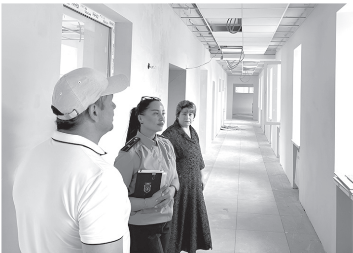
Проверка исполнения госконтрактов на выполнение строительных работ в школах Малокарачаевского района

Прокуратура Малокарачаевского района проверила испол-